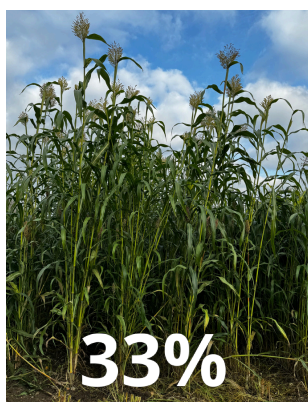
Sorgho hybride sucrier biomasse