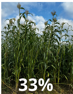
Sorgho hybride sucrier biomasse