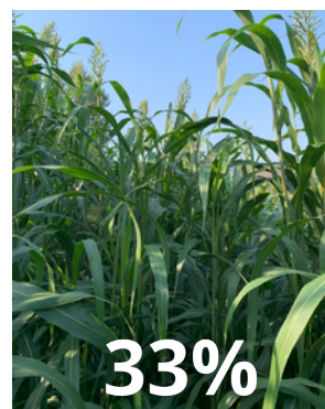
Sorgho BMR hybride précoce de grande taille

→ Cette synergie entre les trois variétés de sorghos ensilage garantit un équilibre optimal : un rendement maximal pour un mélange biomasse haut de gamme, une bonne précocité et un fort potentiel méthanogène !